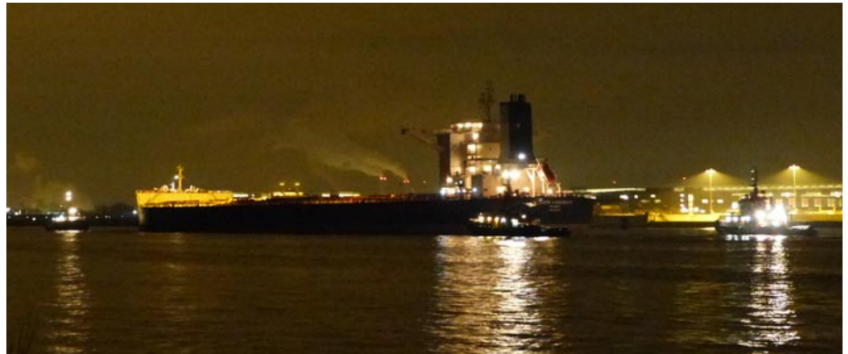
Der voll beladene Bulkcarrier „Cape Leonidas“ musste am 17. Januar 2017 bei Pagensand-Nord wegen eines Maschinenausfalls notankern. Der Einsatz von sechs Schleppern ermöglichte es, dass das Schiff am Abend sicher den Hamburger Hafen erreichte.