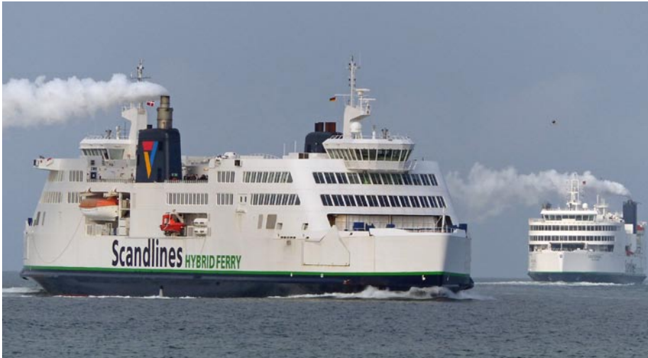
Die Reederei Scandlines betreibt mit vier Hybrid-Fähren (Abgase: Wasserdampf) die Vogelfluglinie. Sie verkehren halbstündlich zwischen Puttgarden und Rödbyhavn.