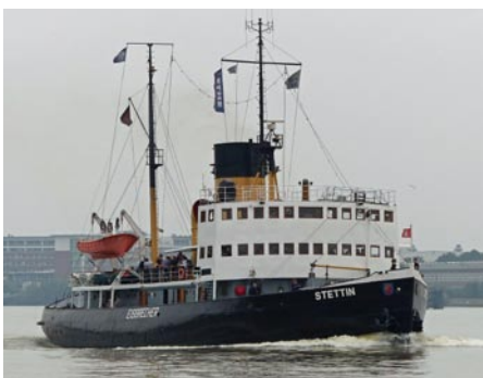
Der Museumseisbrecher „Stettin“

Nach der Kollision des historischen Dampfseisbrechers „Stettin“ mit der finnischen Ro/Ro-Fähre „Finnsky“ im Bereich des Fähranlegers Warnemünde im