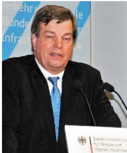
Enak Ferlemann, Staatssekretär im BMVI, begrüßte die Gäste von der Küste.

von Schiffen unter deutscher Flagge unterstreicht die Sorge auch um den seamännischen Ausbildungsstandort Deutschland“, sagte der DNV-Vorsitzende.